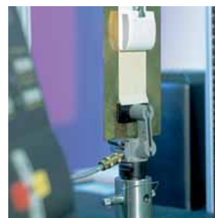
Ensayo de release.