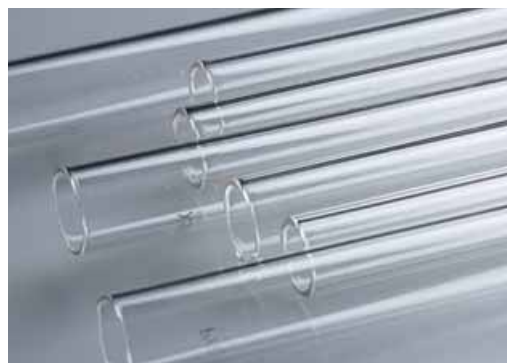
La cohesión del adhesivo y la flexibilidad del frontal son factores importantes cuando se etiqueta en radios pequeños y convexos.

Una buena humectación tiene lugar cuando la tensión superficial del adhesivo es inferior o igual a la tensión superficial del sustrato (derecha).