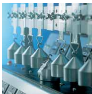
El ensayo de cohesión mide el tiempo necesario para separar la capa adhesiva utilizando un peso de 1 kg.