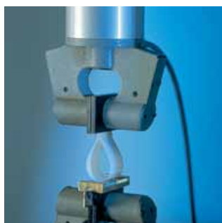
La medición del tack (adhesión inicial) del adhesivo.