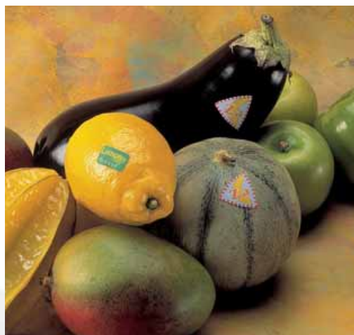
Los adhesivos UPM Raflatac con la certificación ISEGA son adecuados para el etiquetado de frutas y verduras.

Se tratan los adhesivos y la certificación de contacto directo con los alimentos en las apartados A y B del párrafo 21 CFR 175.125 donde se mencionan los alimentos no grasos, secos y húmedos y las aves. No hay ningún párrafo donde aparezcan los alimentos grasos bajo la sección de adhesivos. Los párrafos 21 CFR 176.180 y 176.170 (componentes de papel y de papel-cartón) se aplican a los alimentos secos y a los húmedos y grasos respectivamente.